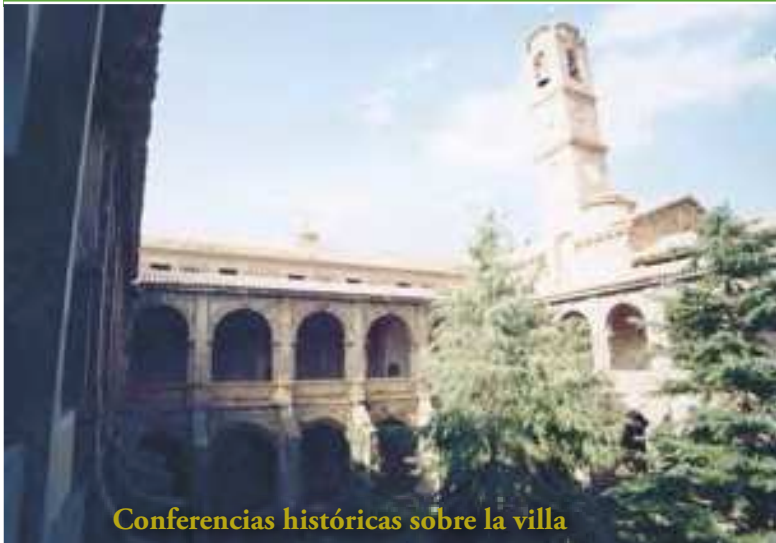
Conferencias históricas sobre la villa