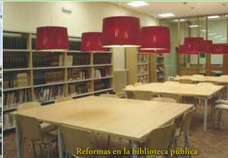
Reformas en la biblioteca pública