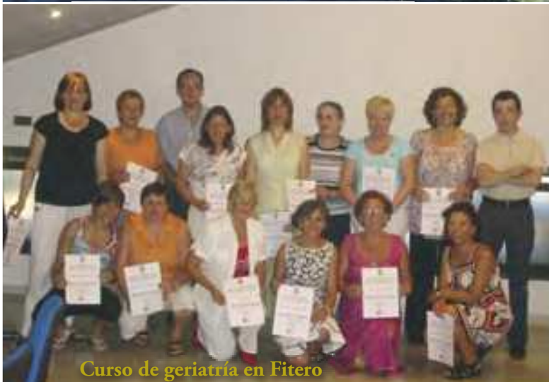
Curso de geriatría en Fitero