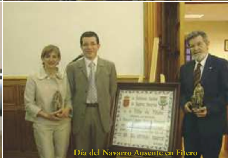
Día del Navarro Ausente en Fitero