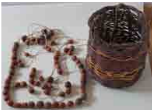
Últimos teruelos usados en Fitero y canastillas en la que fueron recogidos cuando dejaron de usarse.